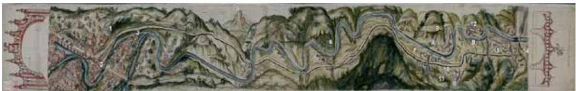
Figura 11. Persistencias en el territorio del siglo XXI. Perspectiva Río Guanajuato, 1785. José de Ayala Matamoros, AGN. Elaboración propia a partir de Bravo y Gnemi (2004). 1. Capilla de Pardo 2. Hacienda de Pardo 3. Hacienda Cantador 4. Hacienda de Rocha 5. Hacienda de Dolores de Barrera 6. Hacienda de San Antonio de Barrera 7. Hacienda de Purísima 8. Parroquia de Marfil 9. Hacienda de Santa Ana 10. Hacienda de San Nicolás 11. Hospital de Marfil 12. Hacienda de San Juan 13. Hacienda de Casas Blancas A. Cerro de la Bufa B. Río Guanajuato

Hasta el siglo XXI se inicia un nuevo proceso de urbanización y refuncionalización del territorio, que influye principalmente en la zona de Marfil Alto y en la presa de los Santos, en las distintas formas -lo que se reconoce como territorialidad- con la imposición de barreras y control del territorio (Sack, 1986).