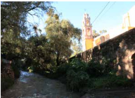
Figura 6. Río Guanajuato y Templo de San José y Señor Santiago, Marfil, siglo XXI.

Transcurridos cerca de noventa años de abandono, el edificio presentaba un estado de deterioro lamentable y riesgoso; es así, que el comienzo de la década de 1990 marca el inicio de una nueva historia para el templo, en la cual afortunadamente la comunidad no fue ajena y jugó en la misma un importante papel, ya que ésta, junto a la decidida acción de los sacerdotes y a la intervención de especialistas, permitieron que el templo, su atrio y parte de la plaza antigua del poblado