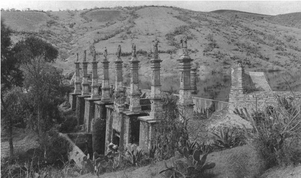
Figura 4. La Presa de los Santos a principios del siglo XX.

de cuadrillas; capilla. La infraestructura para el almacenaje y/o conducción del agua desde el río Guanajuato, fue trascendental en el desarrollo de la actividad industrial de la época. Algunos ejemplos de ésta son las presas de los Santos (Figura 4), de los Pozuelos y de San Pedro de Rocha; así como la Noria Alta.