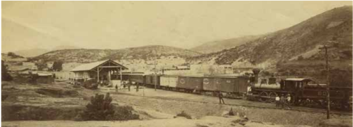
Figura 5. Estación de Marfil FC Central, vista parcial. Ca. 1890.

Aproximadamente veinte años después, este mismo Obispo iniciaría la construcción de la grandiosa Catedral de Morelia (1660-1744).