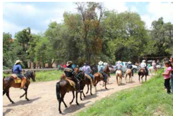
Figura 9. Actividades sobre el camino antiguo o “de abajo”; imagen a la izquierda, actividades deportivas de caminata frente a la Hacienda de San Gabriel de Barrera; imagen a la derecha, cabalgata durante las fiestas del Templo del Señor San José y Señor Santiago.