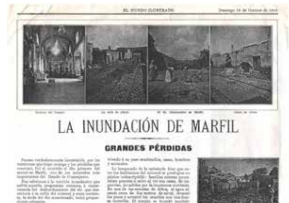
Figura 7. Periódico que habla de los daños causados a la localidad de Marfil, debidos a la inundación del año de 1902.