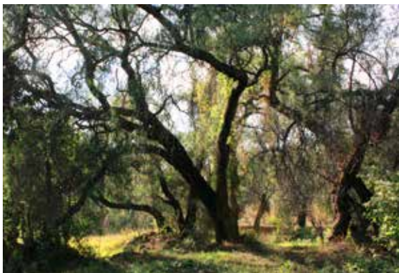
Figura 8. Destaca la vegetación sobre el antiguo camino Real de Marfil a Guanajuato, como valor Paisajístico del sitio.

ahí estuvo y aún permanece, contrastando con lo contaminado del agua (ya que todas las aguas negras de la ciudad se desalojan por allí) y con las montañas de basura entre sedimentos. De alguna forma la naturaleza muestra habilidades para subsistir, pero no sabemos por cuánto tiempo.