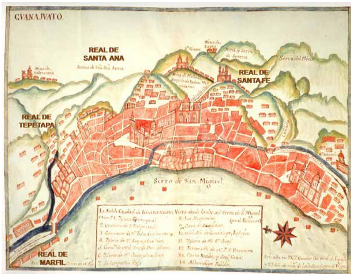
Figura 1. La noble ciudad de Guanajuato, vista desde lo alto del cerro de San Miguel.

ligadas, y funcionando como un sistema. La comunicación entre ellos se hacía a través de un camino o trazo que sigue las sinuosidades del río Guanajuato (Figura 2), y ese tramo, seguramente en un principio fue transitado a través de las veredas formadas en la ribera del río, ya que, hasta el siglo XIX se tiene noticia de la construcción de una calzada para esta cañada de Marfil, la cual llegaba hasta el centro del poblado con este mismo nombre (Marmolejo, 1883, p.56).