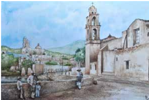
Figura 3. Acuarela del "camino de Abajo" de Marfil, siguiendo las sinuosidades del río Guanajuato, vía de acceso principal a la ciudad a finales del siglo XIX. Autor: Víctor Hugo Aboytés Noria.

tal, el Camino Real de Marfil tenía las funciones que sabemos eran las que se desarrollaban en el llamado Camino Real de Tierra Adentro, que era una ruta comercial que comunicaba a la ciudad de México con Santa Fe, Nuevo México; era igualmente denominado Ruta de la Plata, ya que este producto era uno de los tantos elementos que se transportaban por ese