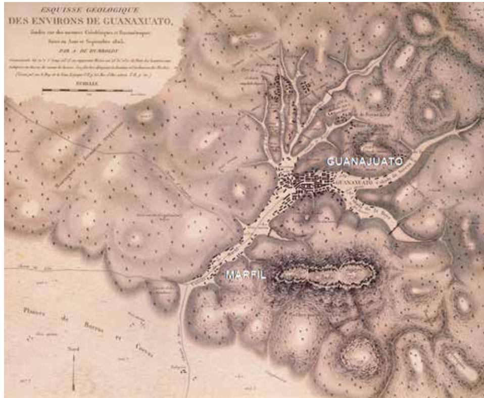
Figura 2. Bosquejo geológico alrededor de Guanajuato, 1803.